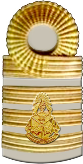
อินทรรู้อ่อนที่ปรึกษา