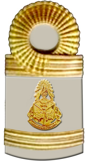
อินทรรู้อ่อนผู้ช่วยเลขานุการ