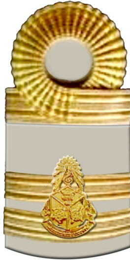
อินทรรู้อ่อนเลขานุการ